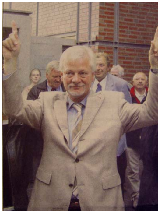
Uwe Bartels gewann mit deutlicher Mehrheit die Vechtaer Bürgermeisterwahl und wurde am frühen Abend im Rathaus von mehreren hundert Bürgerinnen und Bürgern gefeiert.

Gewählter Bewerber: Uwe Bartels, Wahlgruppe „Pro Vechta“ (Pro Vechta)