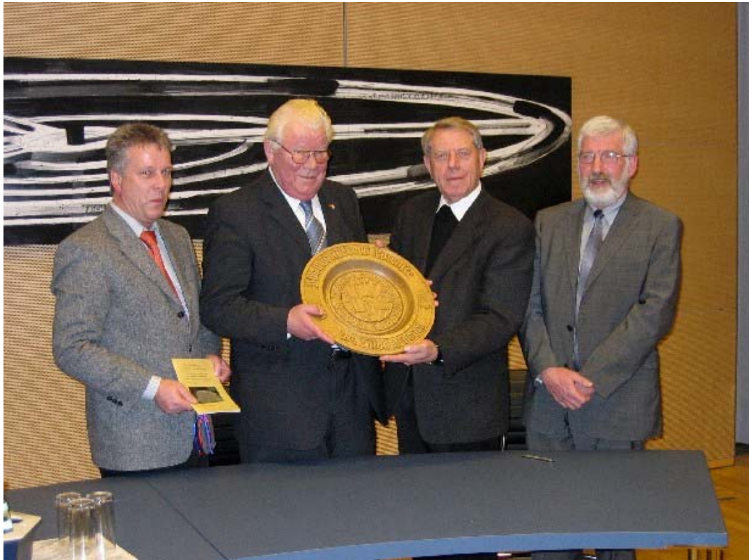
Preisverleihungen im Rahmen des Wettbewerbs n 21 Internet@tlanten durch den Nds. Ministerpräsidenten Christian Wulff am 08.12.2004 im Foyer des Rathauses