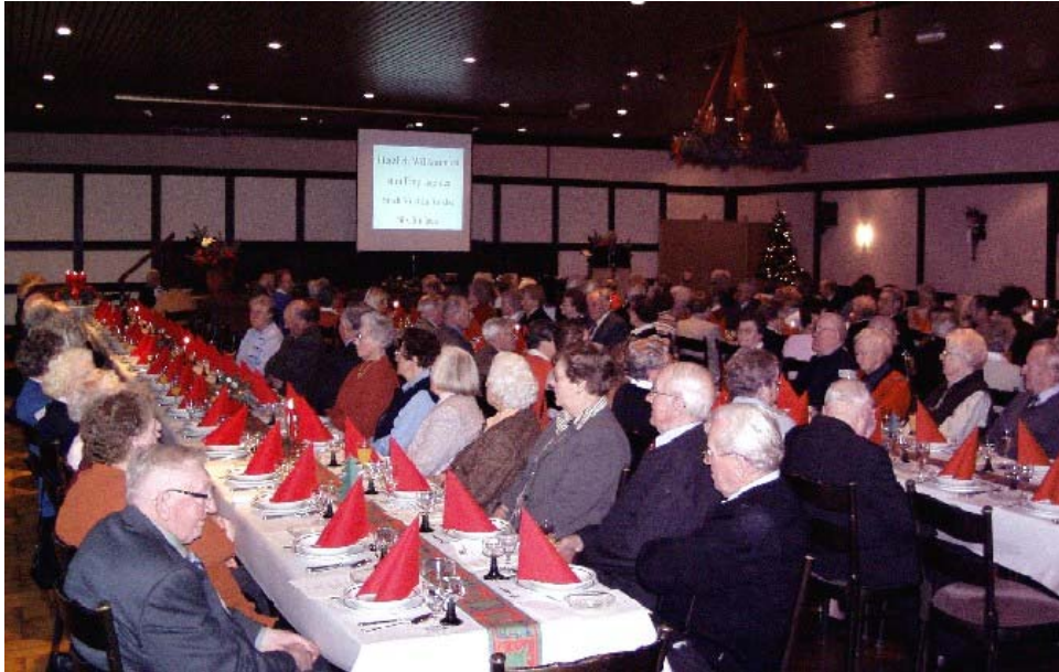
Ehrung der 80-Jährigen im Gasthaus Sgundek

Auch in diesem Jahr hat die Stadt Vechta wieder alle Mitbürgerinnen und Mitbürger, die im Jahre 2004 ihren 80. und 85. Geburtstag gefeiert haben, mit einer weihnachtlich gestalteten Feierstunde geehrt. Die Feierstunde für die 80-Jährigen hat am 13.12.2004 im Gasthaus Sgundek und für die 85-Jährigen am 08.12.2004 im Gasthaus Sextro stattgefunden.