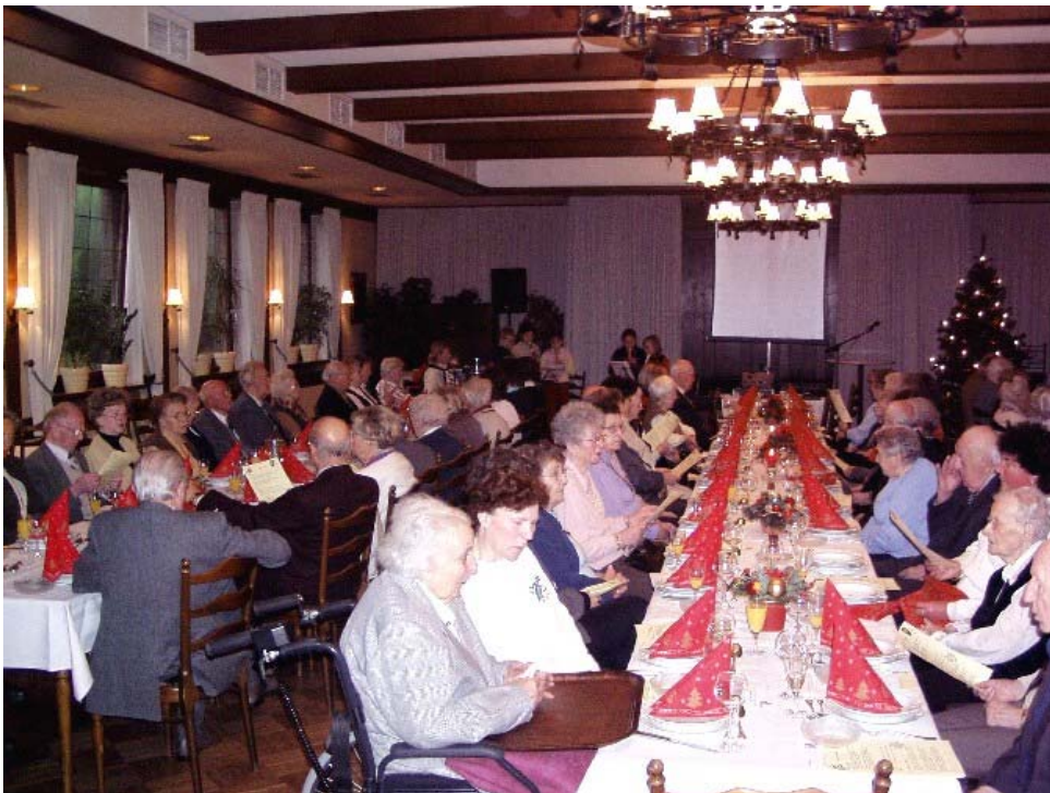
Ehrung der 85-Jährigen im Gasthaus Sextro