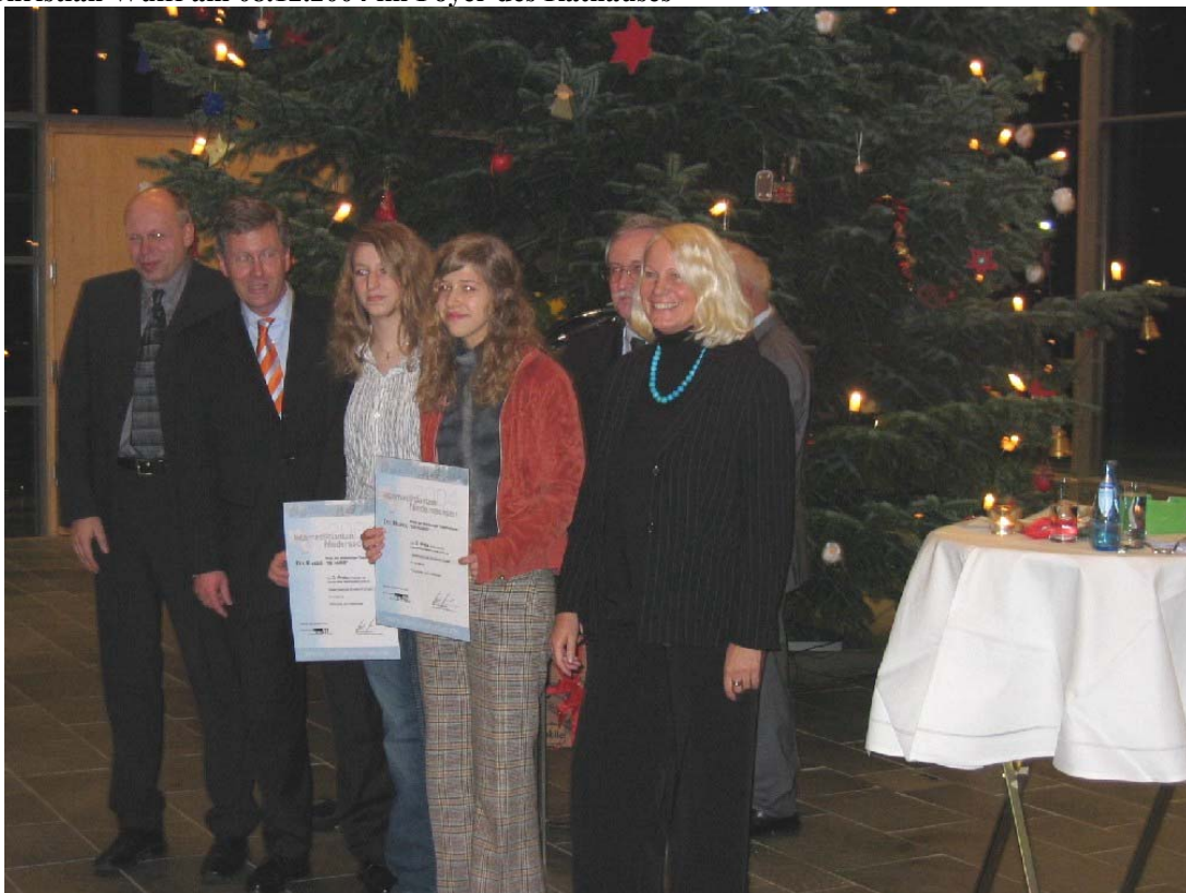
Ministerpräsident Christian Wulff mit den Preisträgern