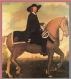
"Christoph Bernhard von Galen und seine Vechtaer Zitadelle" Die absolutistische Militärgeschichte im Fürstbistum Münster