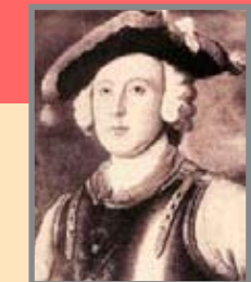
"Die Kanonenkugel des Barons von Münchhausen" Soldatenleben im 18. Jahrhundert