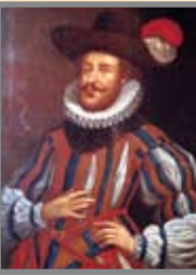
"Die Grafen von Ravensberg" Die Welt des Mittelalters