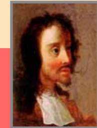
"Simplicissimus in Vechta" Grimmelshausen und der Dreißigjährige Krieg