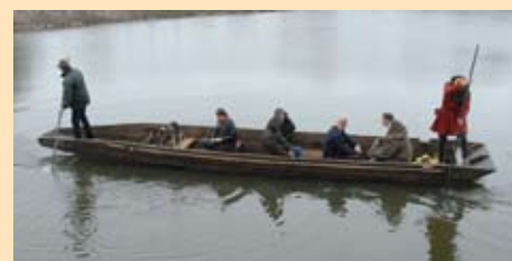
Alle Führungen nach telef.Vereinbarung

mit dem mittelalterlichen Georgsboot auf dem Zitadellengraben