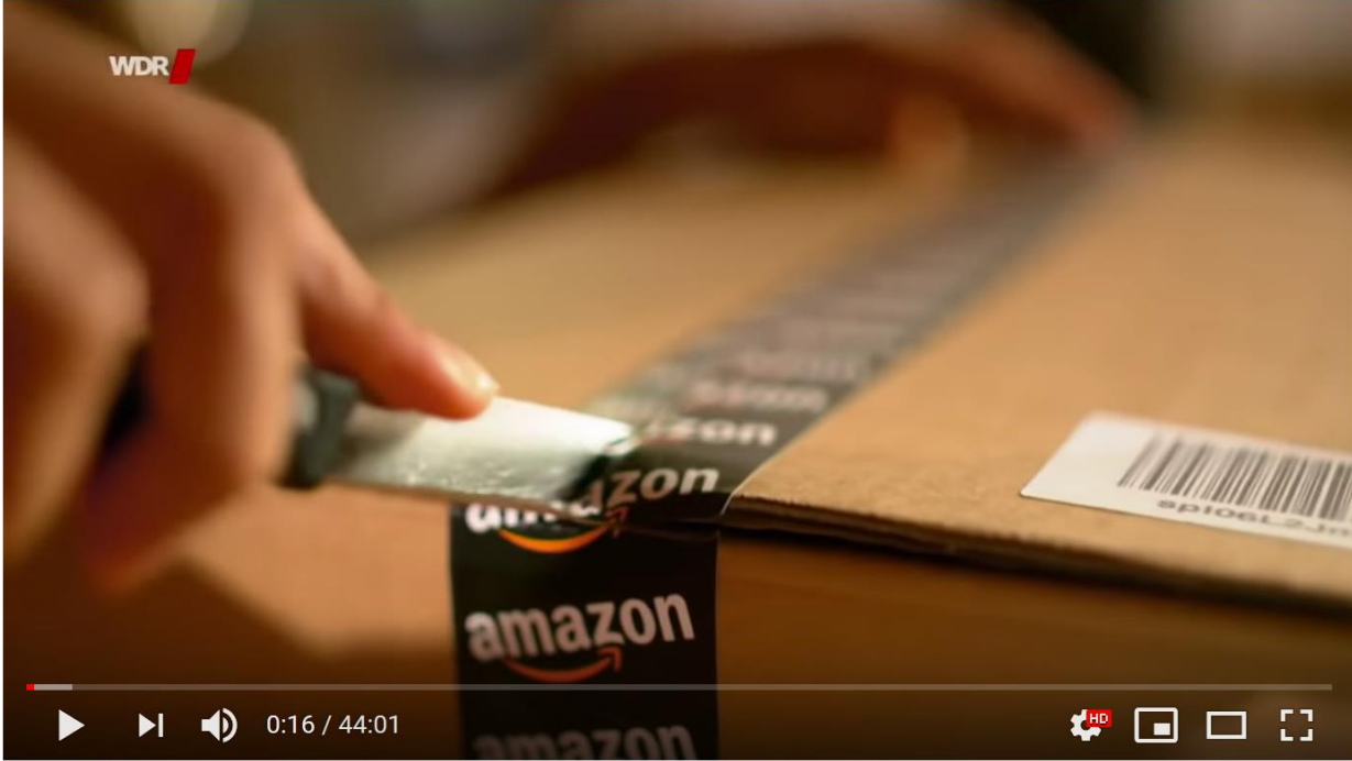
Allmacht Amazon - Die Story (WDR 05.12.18)